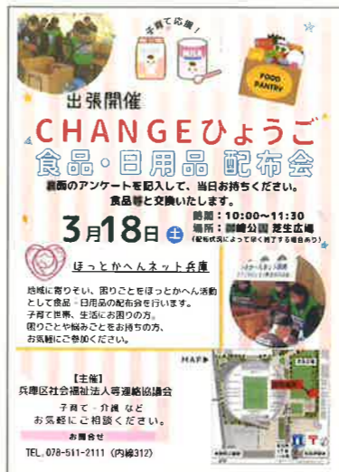
食品・日用品の配布会のチラシ

す。法人内にほつとかへんネットの意義を浸透させることは、職員を積極的に活動へ送り出す理解につながります。また、他の法人との交流は、あらためて自法人の理念や活動を見つめなおす機会になり、参加する職員のモチベーションの向上にもつながっています。 さらに、この活動は「ゆるく」「楽しい」「つながりだと言います。『あれはダメ』と制限をかけられる活動ではなく、種別や世代を超えて、法人職員同士がチームで知恵を出し合い、一緒に「ワクワク」する取り組みを実践していることが主体的な活動の好循環につながっています。