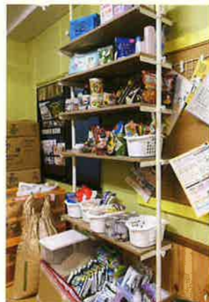
本と食糧の“物々交換”により、支援する・されるの関係を越えたつながりを目指す（チェンジひょうご）

ほつとかへんネットの目的は、社会福祉法人の本業である制度の狭間を含めた住民の困りごとを、「ほつとかへん」で受け止めること、そして誰もが暮らしやすい地域づくりの一翼